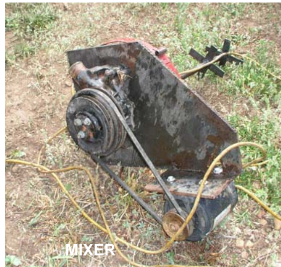
Gambar 2. Proessor dan Mixer Pengolah Biodiesel